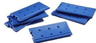
Køleelementer små – 6'er pack

Mål: 560 x 360 x 25 mm Vægt: 2,550 kg. Materiale: PE – plast V. nr.: 095-02