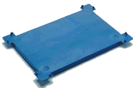
Køleelement til eks. platter

Mål: 600 x 400 x 25 mm Vægt: 2,560 kg. Materiale: PE – plast V. nr.: 095-42